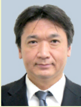
循環器内科部長 国際医療福祉大学 医学部教授