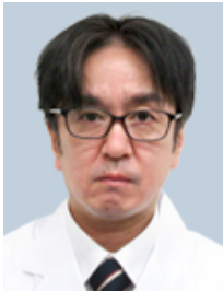
循環器内科副部長 国際医療福祉大学 病院准教授