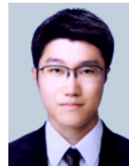
国際医療福祉大学 病院助教

日本内科学会認定総合 内科専門医、日本心 血管インターベンション 治療学会認定医